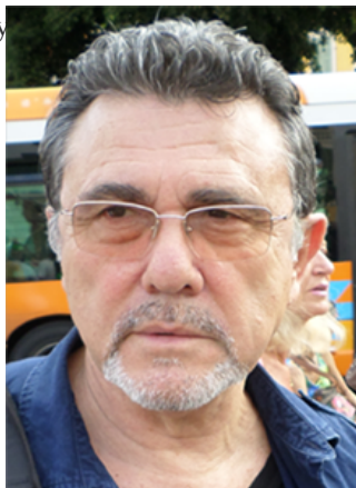
Шломо Занд *

Тактический уровень отчасти прописан в Талмуде: «Неравный статус «чужого», т.е. нееврея, в иудаизме, вообще говоря, не столь бесспорен и однозначен, как, например, в следующей талмудической цитате: «Вы именуется людьми, а народы мира не именуется людьми», Вавилонский Талмуд, трактат Йевамод, 61а».* Впрочем, без толкователей Талмуда, переведивших данные словесные экзерсисы далее на бытовой уровень, они так бы и оставались балластом. Требовалось творческое, эмоциональное донесение их до паствы. Тому близкий нашему