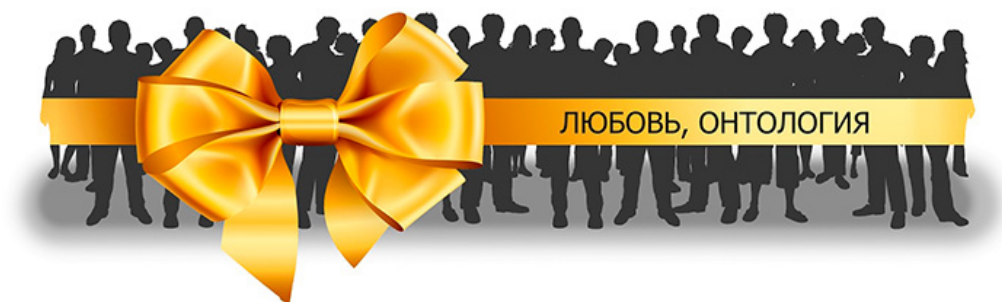
Рис.: Эволюционный подарок